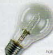
hálózati feszültségű, E27 fejtelt halogénlámpa