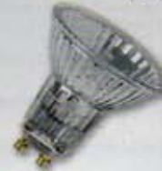
hálózati feszültségű, alumíniumkúpú halogénlámpa (GU10 fej)