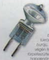
belső körfolyamatú, burán egy végén fejtelt, közelesfeszültségű, halogénlámpa